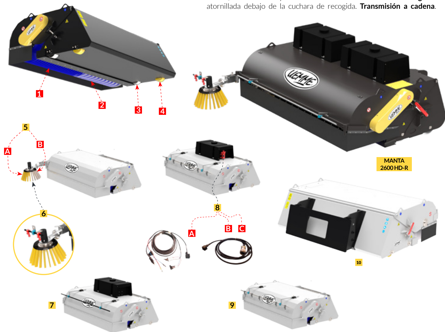
MANTA 2600 HD-R

Barredora con cuchara de recogida para aplicación frontal en grandes maquinas para movimiento de tierra y cantera. Cada modelo de MANTA HD-R está equipado de serie con 4 ruedas para desplazamiento cuchare (que se pueden elegir en acero o recubiertas de poleceno ), sistema flotante trasero , bandas de goma de protección lateral y frontal, tubos flexibles y cuchilla de doble corte en acero antidesgaste atornillada debajo de la cuchara de recogida. Transmisión a cadena .