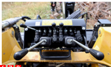
6 7 8